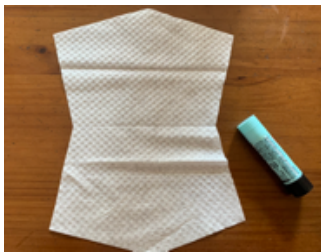
④マスク部分をを開いて、中央のにりをつけます