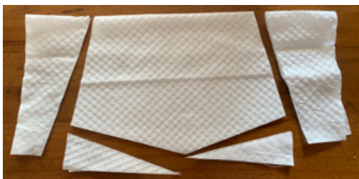
②キッチンペーパーを2つ折りにして、型紙をあてて切り取ります。点線部分は、切りません。押し切りがあれば、型紙と一緒に裁断すると早いです