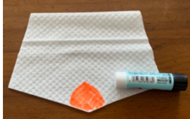
⑧オレンジの部分にのりをつけます