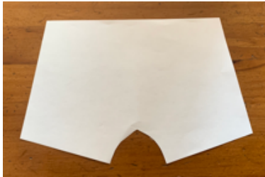
②線に沿って切り取ります。