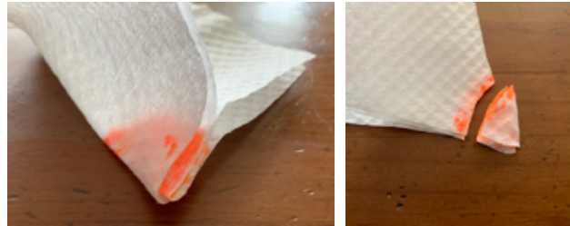
⑨オレンジの部分を貼り合わせて、不要な部分を切り取ります。