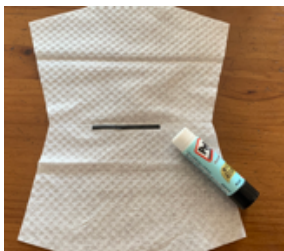
⑤中央にビニールタイをおきます