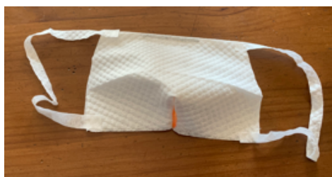
⑫適当な長さ（人によってちがいます。結構伸びます）に切って4つの角にのり付けします。