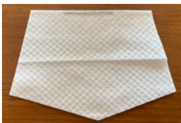
⑥元通りにとじます