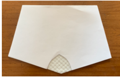
⑦型紙をもう一度マスクにあてます